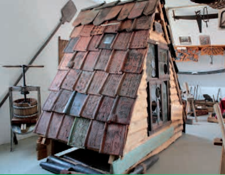
Altes Bergmannsgezüe, gefunden im Hülfstollen Abbaagebiet