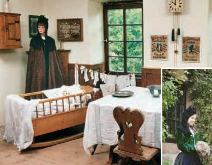
Wohnstube um 1900