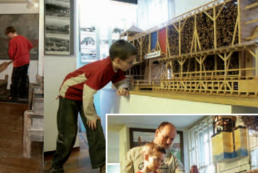
Modell eines Gradierwerkes