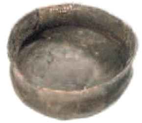
Beigabefäß zu einer Urnenbestattung um Christi Geburt. Fundort: Schwebda, 1949

Teil eines Klassenzimmers der ehemaligen Volksschule und eine Küche mit Wohnzimmer aus dem 19. Jahrhundert. Alte Wasch- und Mangelutensilien sind zu betrachten und eine mittelalterliche Kirchturmuhre mit einem "Kirchenstand" aus dem 18. Jahrhundert. Einer Bücherecke mit heimatkundlicher Literatur, einer Fotoausstellung und dem Archiv ist ein separater Raum gewidmet. In einem weiteren Raum werden Teile der Grenze zur ehemaligen DDR und historische Fotoapparate gezeigt. Die Sonderausstellung mit funktions-tüchtigen Fernsprechapparaten ab 1904 runden das Angebot des Heimatmuseums Meinhard in Schwebda von der Vor- und Frühgeschichte bis in die neuere Zeit hinein ab.