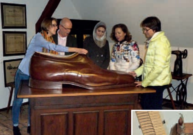
Der „größte Schuh Hessens“

Heimattfest, dem „Johannisfest“, Raum gegeben. Eine weitere Besonderheit sind Fotografien und Fotoapparate aus einem der ältesten Fotoateliers in Deutschland, dem Atelier des „Hoffotografen“ Tellgmann. Schließlich widmet sich das Museum auch der Archäologie und der Naturgeschichte der Region. Zu sehen sind Grabungsfunde aus dem Werratal von der Steinzeit bis ins Mittelalter. Außerdem sind Mineralien, Versteinerungen und eiszeitliche Tierknochen der Umgebung ausgestellt. Ein großes Diorama zeigt die Tierwelt des Werratals. Wechselnde Veranstaltungen laden immer wieder zu einem Museumsbesuch und auch zu einem Gang durch den wunderschönen Sophiengarten ein, der in direkter Nachbarschaft gelegen ist.