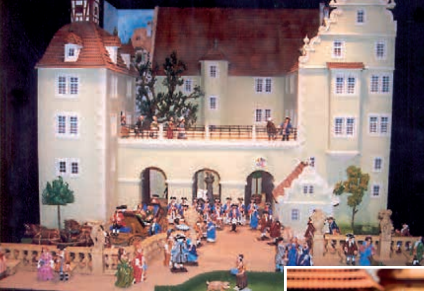
Das Landgrafenschloss um 1755